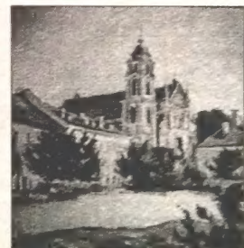
Храм на Вілейцы. У. Кузьменка

Станіслаў Зялёнка стварае палотны, дзе рэалізм сусінуе з пазарэальнасьцю. Невядомы ў жывапісе глядач можа спалохацца і прыняць краёвіды мастака за магнічныя знакі. Тут лірыка сябрае з прыціхай таямнічасьцю.